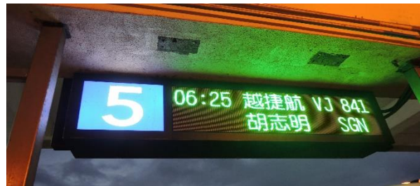
圖 1：搭上前往越南的班機

自從申請上國立台灣海洋大學就很希望有出國交流的機會，但礙於僑生的身份，學校無法提供補助。於是很多學校推廣的校外交換生都無法參與。當時聽說學校有一個越南實習計劃，喜歡環遊看世界的我剛好也還沒去過越南，