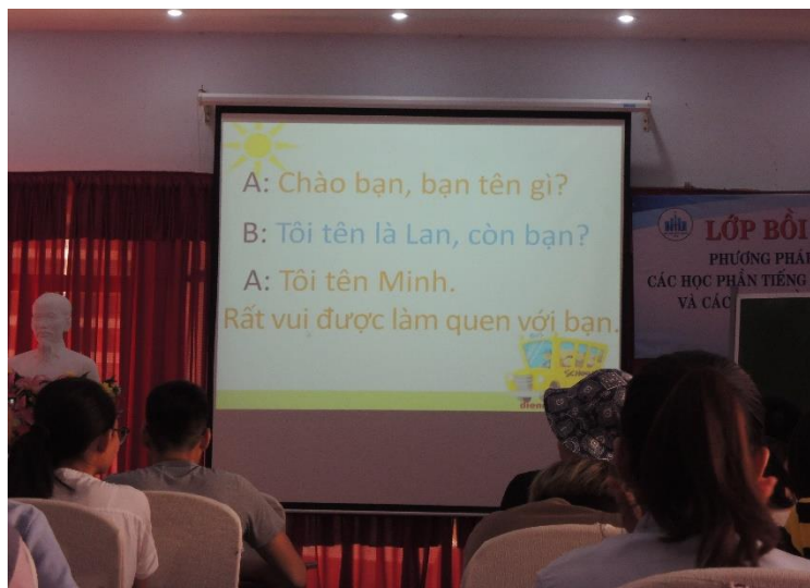
圖 5：上越南課的情形

Ba, 4 = Bốn, 5 = Năm, 6 = Sáu, 7 = Bảy, 8 = Tám, 9 = Chín, 10 = Mười。老師還進階的教我們怎麼以越語說越南盾的幣值。接著，老師教大家唱兩首越語歌，並把大家分成三為越南朋友搭配兩位台灣朋友為一組。我很幸運的跟三為漂亮的越南朋友們組成一組。他們很熱情用心的在 10 分鐘內教會我們越語歌，雖然過程中爆出很多發音不准的笑話，我們