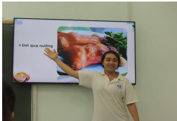
圖 18 和圖 19: 介紹越南美食

接下來就是考考大家有沒有認真聽課，每個人都很積極的舉手搶答，打錯的台灣朋友們就要上台演唱一首歌。遊戲結束後，我們又再次被分成幾組，與越南的朋友們進一步討論彼此家鄉的美食。因為我來自馬來西亞，也是一個東南亞國家，所以在討論的過程中發現到我們的食物很相似，都是偏酸辣，口味頗像。然後我們也給彼