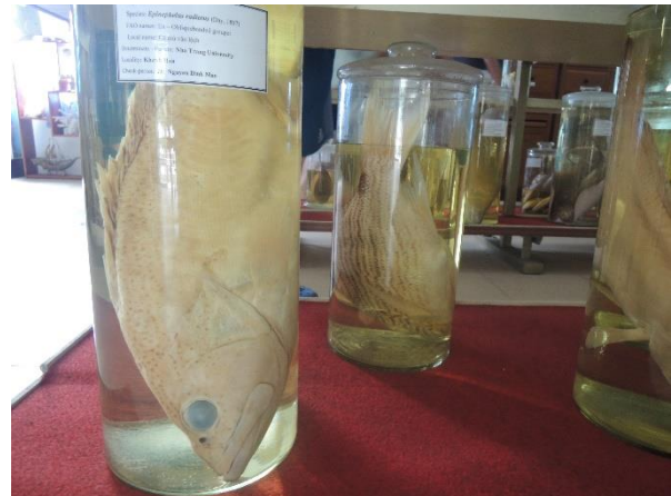
圖 8 和圖 9：各式各樣的標本