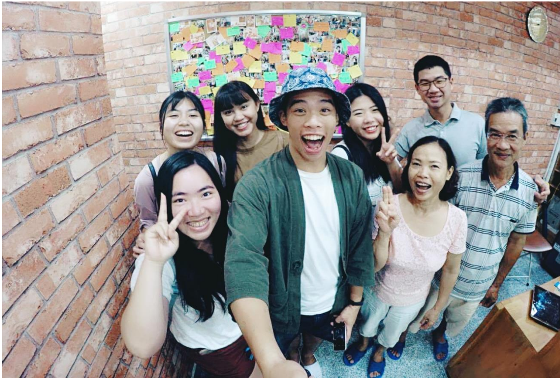
圖 27：與房東一家合影

我們解決很多溝通上的問題，而他的家人也常常邀請我們一起共進晚餐。我們很幸運可以找到這麼一個好房東。