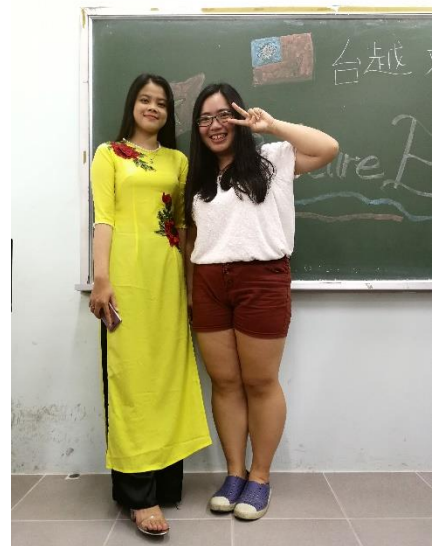
圖 20: 與穿越南傳統服裝的主持人合照

接下來就是考考大家有沒有認真聽課，每個人都很積極的舉手搶答，打錯的台灣朋友們就要上台演唱一首歌。遊戲結束後，我們又再次被分成幾組，與越南的朋友們進一步討論彼此家鄉的美食。因為我來自馬來西亞，也是一個東南亞國家，所以在討論的過程中發現到我們的食物很相似，都是偏酸辣，口味頗像。然後我們也給彼