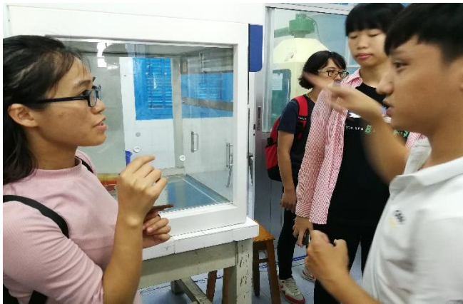
圖 10：同學很認真地在發問

此次參訪除了參觀系館，我們也很幸運的可以有機會參觀他們的實驗室。首先參觀的是水產養殖系相關的實驗室。他們實驗室派出一位學生帶領大家參觀，並向大家講解各類儀器的作用。相較於我的實驗室，他們的實驗室空間略大，但是所應有的儀器較