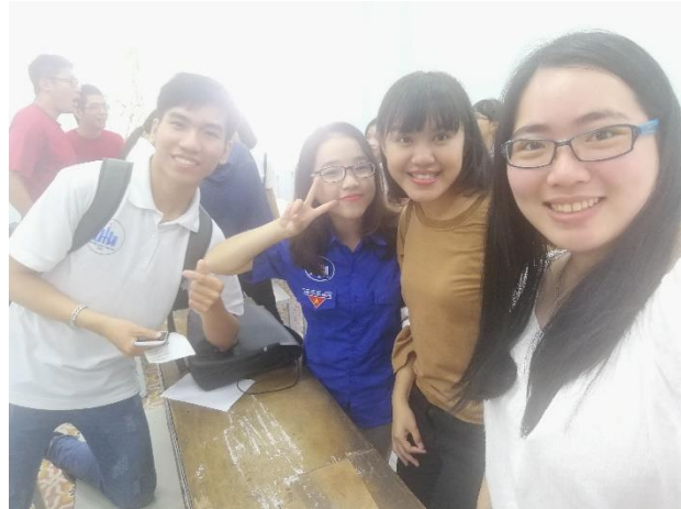
圖 21：一起討論的組員團體照

此介紹了一些必吃的美食，下一次他們來到我們的國家，他們也可以好好的吃我們國家的美食。這個交流會不但讓我們更了解越南文化，也讓他們對我們有所了解，很開心可以參與這個越南文化交流會。