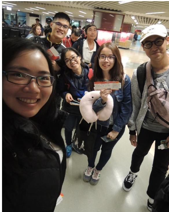
圖 2：認識了一起搭飛機的朋友

瞬間好想到越南看看那邊的人情事物及傳統文化。眼看機會就在眼前，就興致勃勃的考慮要不要參與此次越南實習計劃。礙於我是研究所的碩二生，我還是找了老師討論自身的實驗進度是否會受影響以及其他課程事項，來斟酌是否適合參與此次計劃。最後，雖然覺得研究生難免有課業與時間壓力，但是又看到越南的吸引力，再加上教育部補助的金額，根本無法抗拒。於是，決定放手一搏申請參與這個為期兩週的交流與學習之旅。