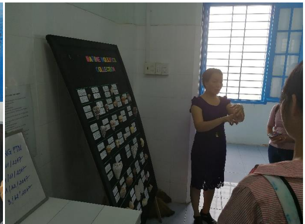
圖 13：老師在介紹各種貝類