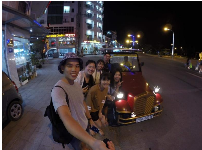
圖 28：與復古版計程車合影

越南的公共交通工具少之又少，住在越南的 14 天只看到三次的公車，所以基本上大家都是以計程車和走路為主。計程車還分成現代版和復古版。復古版真的很值得去體驗一回。再來，大家一起沿著海岸線散步的感覺其實很不錯。