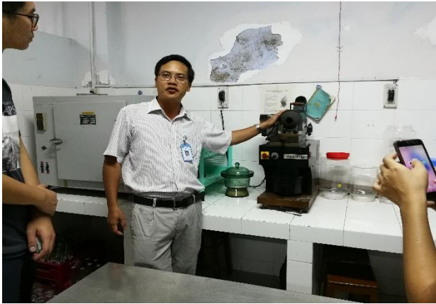
圖 14：老師介紹咖啡的由來

接著，我們前往食品科學系的習慣與實驗室。曾經在國立台灣海洋大學食品科學系攻讀碩士，如今是芽莊大學其中一位專業的老師，他負責帶領我們大家參觀並解說。其中，他介紹越南數一數二的咖啡豆——綠咖啡豆，並當場示範給我們看如何操作咖啡機，將咖啡從生變熟，再從顆粒變成粉狀，在泡成一杯杯的咖啡。這個過程中，我才了解原來咖啡豆不是本身就是黑色的，而是在煮的過程中慢慢變黑。