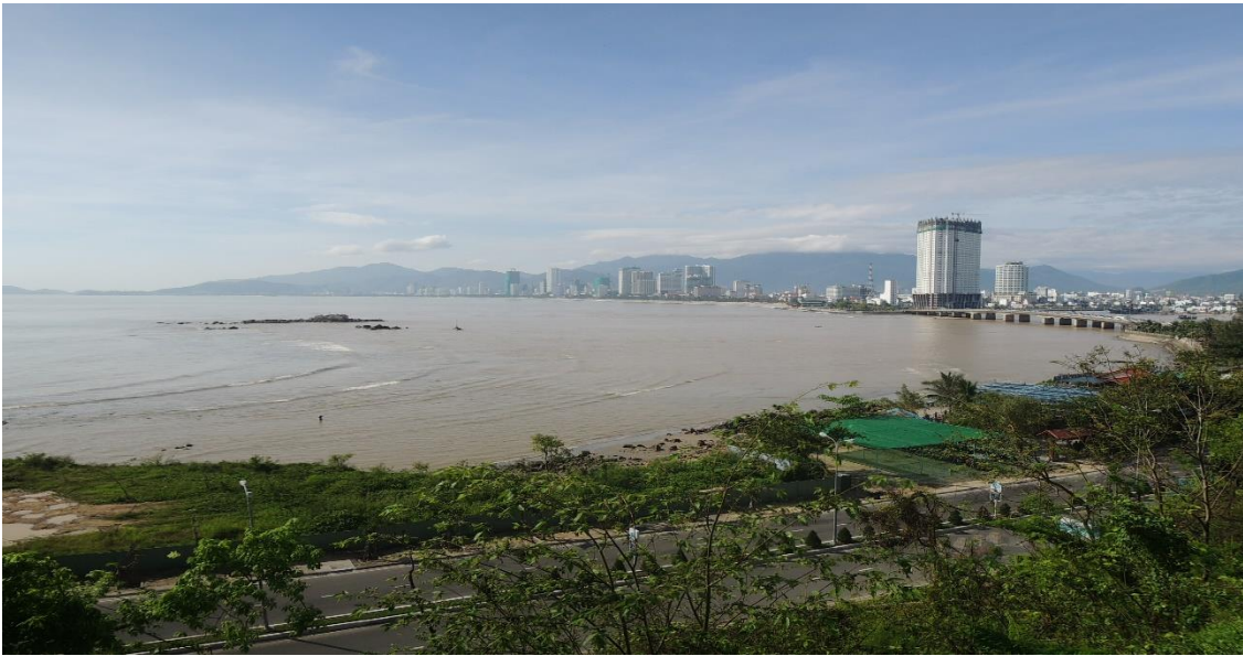
圖 3：從芽莊大學往下看的海景

芽莊大學 (Nha Trang University, 簡稱 NTU) 位於越南的芽莊市，靠近越南最美的沿海海岸。NTU 是越南全國上下 50 所大學中，其中一所擁有超過 50 年歷史的大學。NTU 的起身主要以漁業系與養殖系為主，到後來才慢慢往多元系的方向發展，才得以看到如今蓬勃發展的芽莊大學。NTU 也不吝與國內國外的各所大學進行合作交流，以確保學生們可以擁有更多國際觀並將學校提升到國家社會經濟發展的需求。