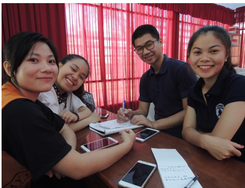
圖 6：新認識的三位越南女生，擔任小老師