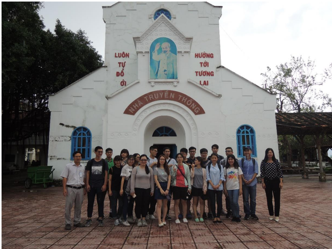
圖 16：參訪完畢後的團體照