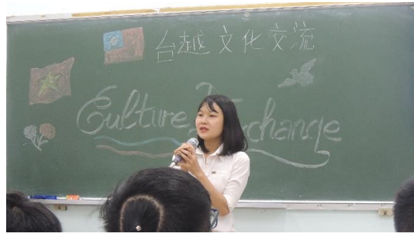
圖 17: 越南朋友演唱越語歌

外語系的越南朋友們給我們辦了一場台越文化交流會。不得不稱讚的是外語系的他們把中文學得很好，溝通流利，讓我覺得敬佩不已。交流會有各式各樣的表演，印象最深刻的是一位越南女